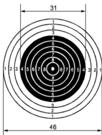
Мишень № 8. Размеры даны в мм